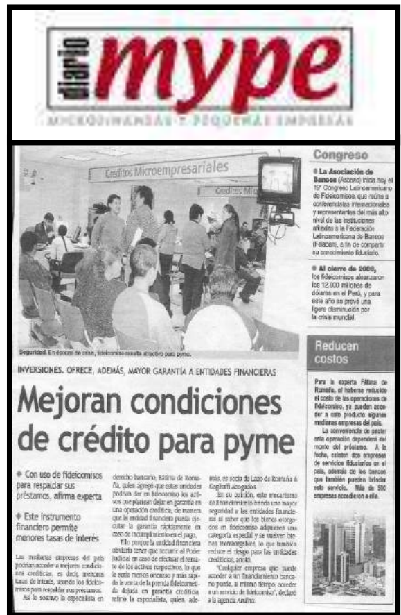
Diario Mype. Artículo referente al otorgamiento de crédito para pyme